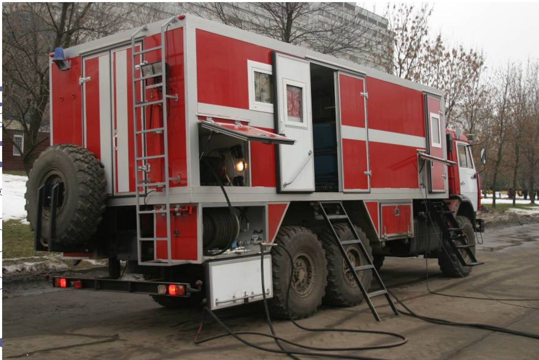
Spraying Unit Multifunctional URM